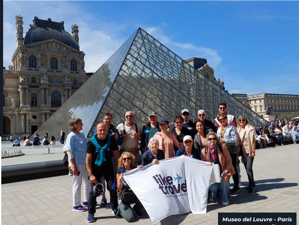
Museo del Louvre - París Francia

Un itinerario equilibrado, completo y pensado para que disfrutes Europa a tu ritmo, sin dejar de vivir lo esencial.