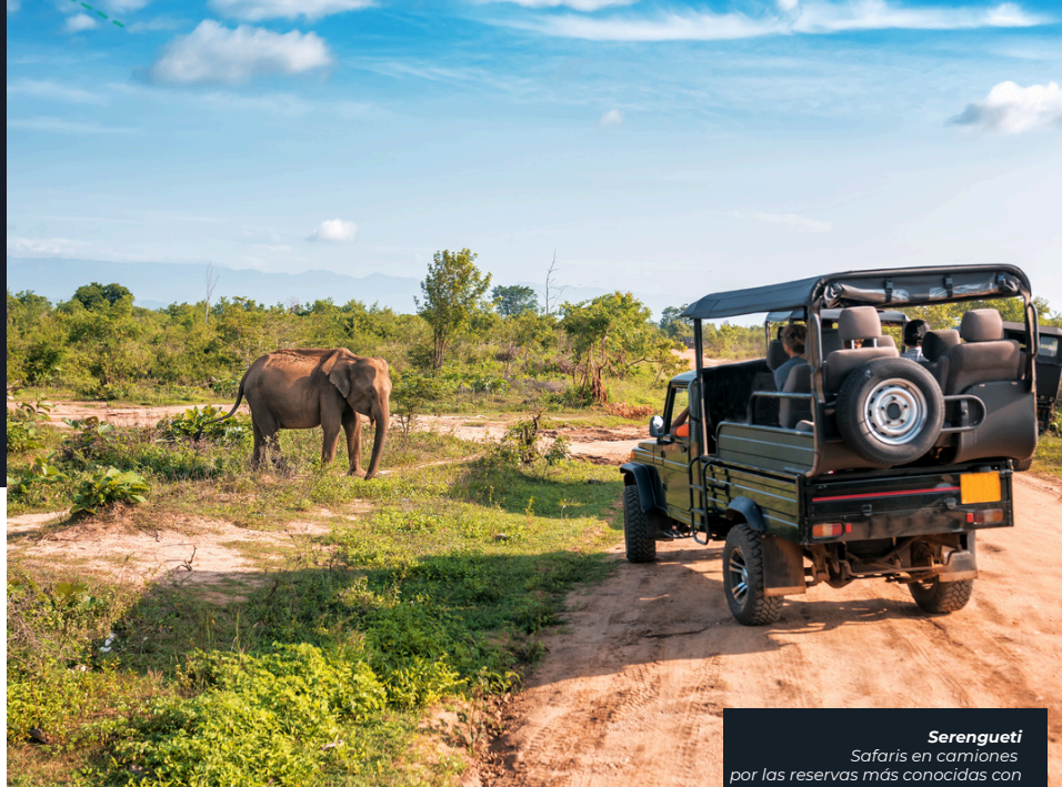
Serengeti Safaris en camiones por las reservas más conocidas con expertos

Una experiencia completa que reúne naturaleza, cultura y descanso, pensada para quedar en tu memoria para siempre.