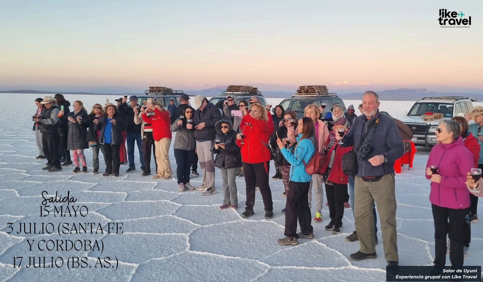
Salar de Uyuni Experiencia grupal con Like Travel