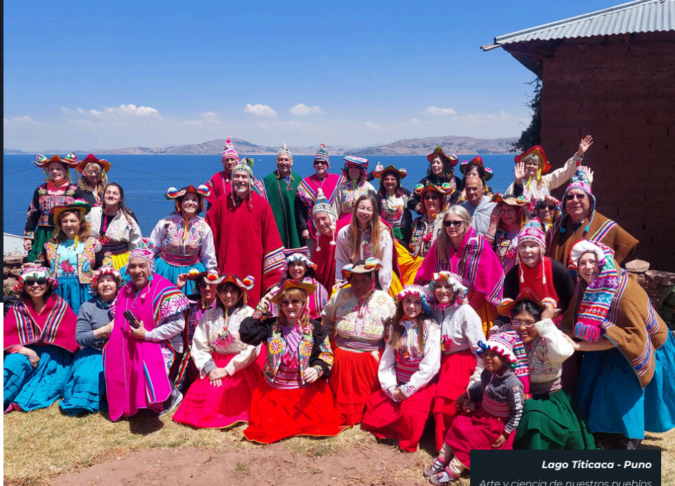
Lago Titicaca - Puno

Todo esto, sumado a muchas otras visitas imperdibles, lo descubriremos junto a un guía experto que hará de cada momento una experiencia inolvidable.