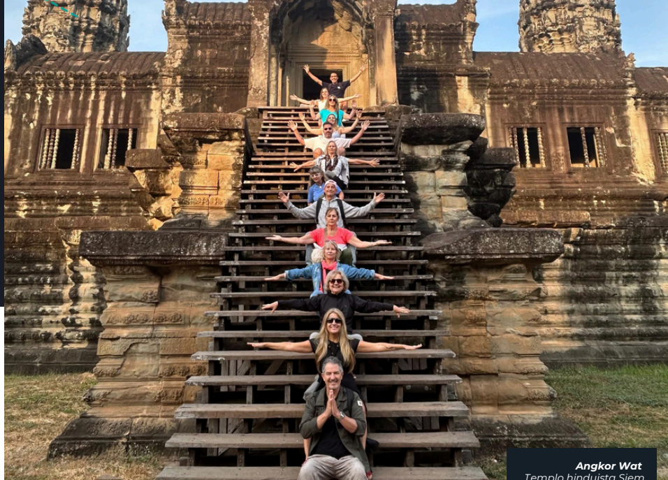
Angkor Wat Templo hinduista Siem Reap, Camboya

Viajaremos a la exclusiva isla de Koh Lipe con sus aguas cristalinas y callecitas peatonales. ¡Terminaremos el tour con la modernidad deslumbrante de Singapur! Mezcla de todas las culturas, en el barrio árabe, el barrio chino o el barrio hindú. Además, su modernidad en Gardens By the Bay que crean el entorno perfecto al icónico Marina Bay. Mucho más nos espera para despedir este viaje que llenará sus pupilas y sus corazones.