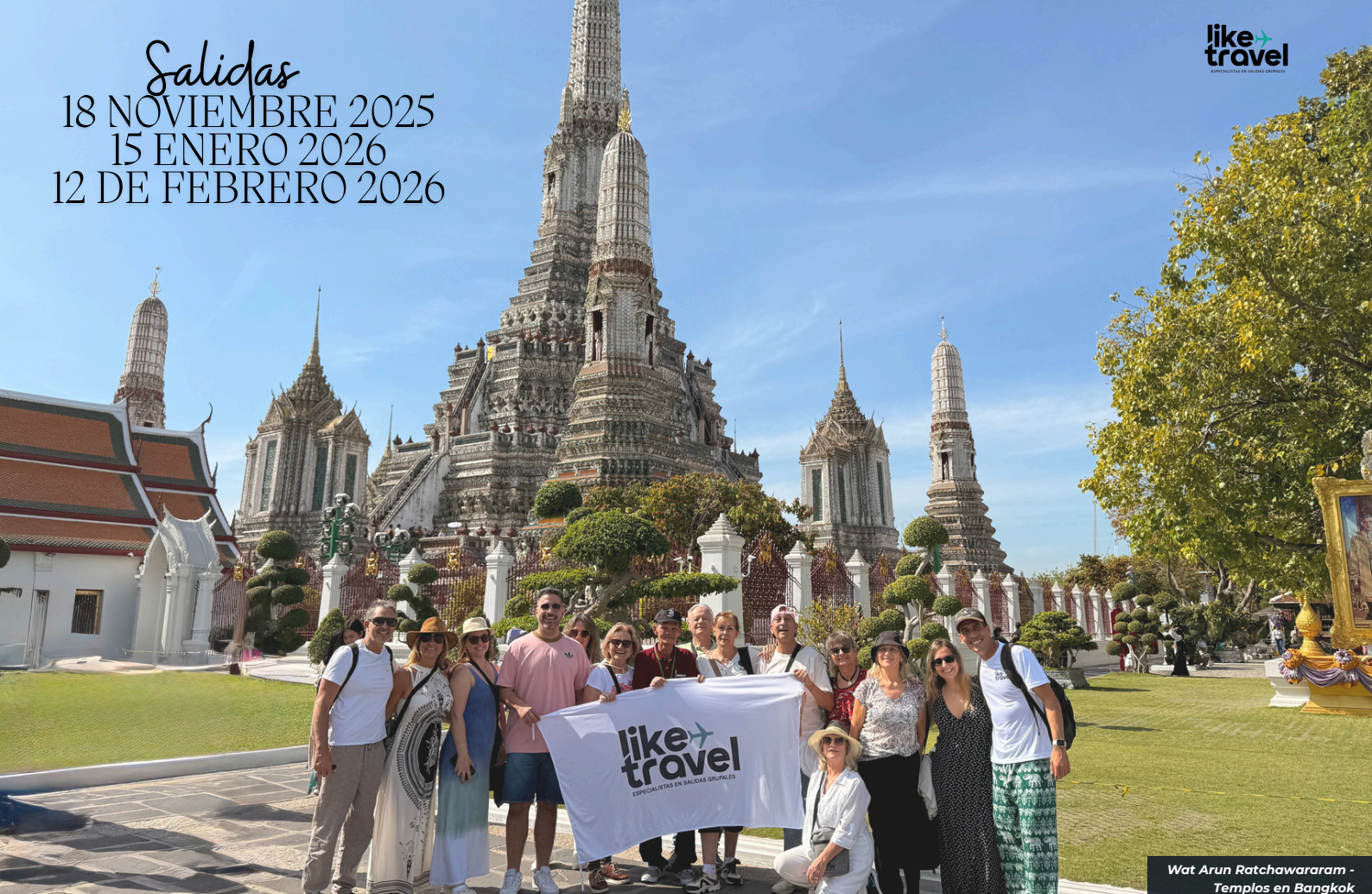
Wat Arun Ratchawararam - Templos en Bangkok

Salidas 18 NOVIEMBRE 2025 15 ENERO 2026 12 DE FEBRERO 2026